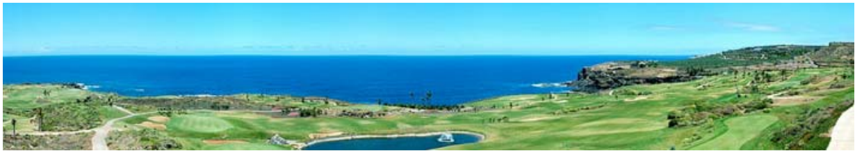
Campo de golf (Tenerife)

La oferta de alojamiento junto a los campos es más que variada y de la mejor calidad; allí encontrará todo lo necesario para unas perfectas vacaciones de golf.