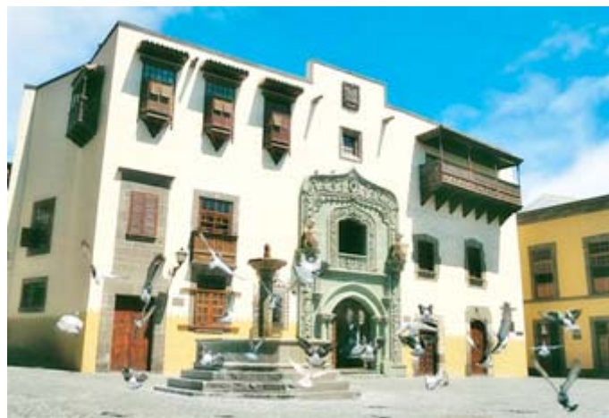
Casa de Colón (Las Palmas)

Su patrimonio histórico lo conforman pueblos y ciudades llenos de edificios de herencia colonial y construcciones típicamente canarias, con balconadas de madera y hermosos patios; calles empedradas y lugares muy conservados, donde dejaron huellas innegables otras culturas y pueblos.