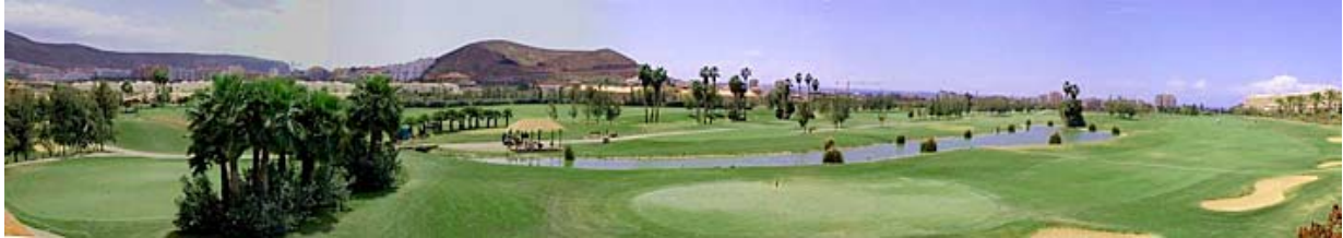
Campo de golf (Tenerife)

Buena parte de los clubes disponen de escuelas de reconocido prestigio, donde podrá tomar clases para iniciarse o mejorar su swing.