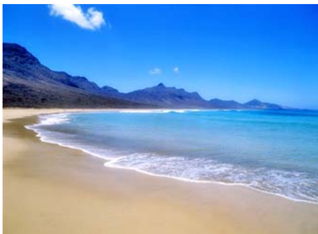
Playa de Cofete (Fuerteventura)

Sus aguas se mantienen todo el año entre los 18 y los 23 grados, existiendo las mejores condiciones para la práctica de la vela, con deportes como el windsurf o el kite surf, así como navegar en compañía de ballenas y delfines en libertad.