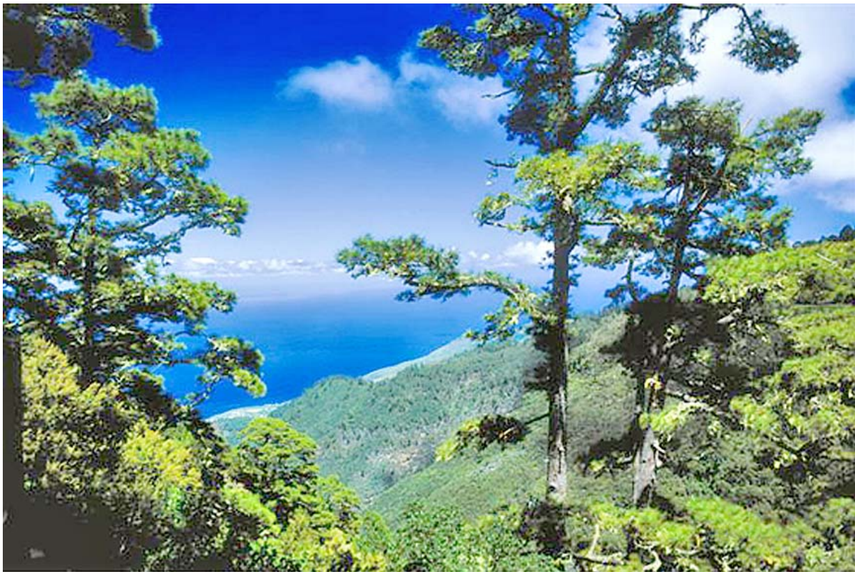
Cumbre de La Palma

Las suaves temperaturas de las Islas permiten disfrutar 365 días al año de todas sus posibilidades de ocio al aire libre; senderos a pie, a caballo o a lomos de un camello; cicloturismo o descenso de barrancos; explorar los tubos volcánicos; escalar paredes increíbles o sumergirse en aguas transparentes, rodeado de rayas y pedregales. Pero también podrá volar sobre sus montes y playas, en un vuelo en parapente.