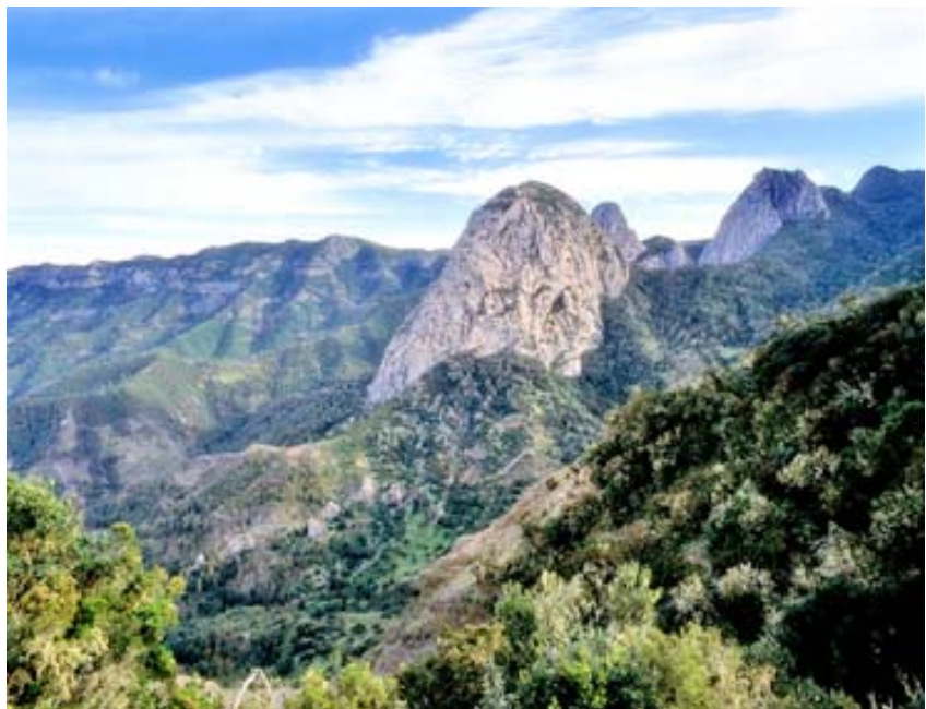
Garajonay (La Gomera)

Cuatro Reservas de la Biosfera en El Hierro, Gran Canaria, Lanzarote y La Palma; 141 espacios naturales protegidos, que se enriquecen con las más de 1.386 especies de plantas autóctonas, de las cuales, 540 son endémicas; así como 29 monumentos arqueológicos.